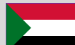
Sudan – 1