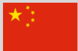
China - 1