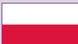
Polonia – 1 (1)