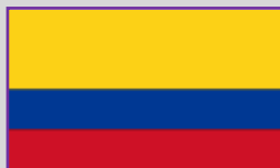
Columbia – 1