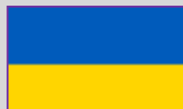
Ucraina – 14(4)