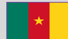
Camerun – 1