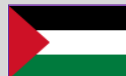
Palestina – 3