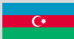
Azerbaidjan – 2