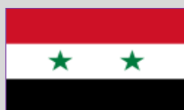
Siria – 21