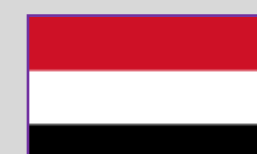
Yemen – 17