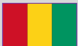
Guinea – 4