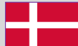
Danemarca – 2