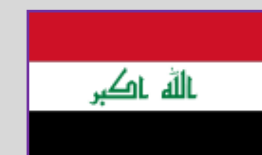
Irak – 1