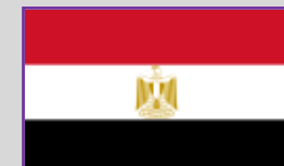
Egipt – 1