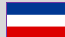
Iugoslavia – 1