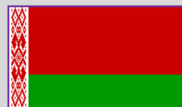
Belarus – 3 (2)