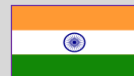
India - 1