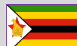
Zimbabwe – 2