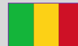
Mali – 2