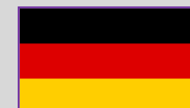
Germania – 6