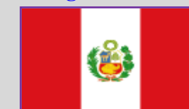
Peru – 1