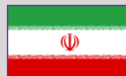
Iran – 2