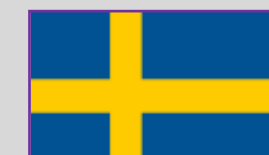
Suedia – 2