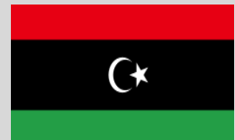
Libia - 1