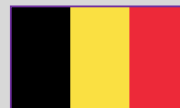
Belgia – 1 (1)