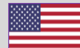
SUA – 5