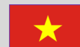
Vietnam – 13 (1)