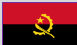
Angola - 2