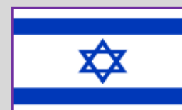
Israel – 6