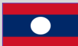
Laos – 1