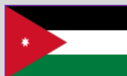
Iordania – 54