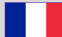
Franța – 1