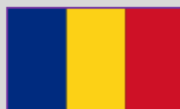
România- 396 (3)