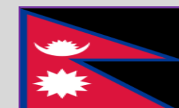
Nepal – 2